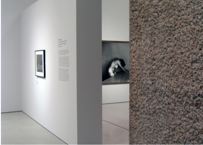
In the Face of History