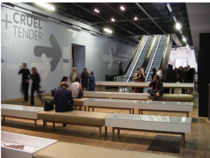
Cruel and Tender