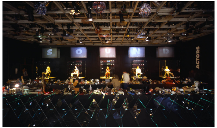
Spellbound Sound piece

De regels van de filmcensuur waren van toepassing op de tentoonstelling, wat betekende dat films voor boven de achtsten apart vertoond moesten worden. Damien Hirst werd vervolgens toegestaan om zijn speciaal voor deze gelegenheid gemaakte film 'Hanging Around' in zijn eigen filmzaal te vertonen.